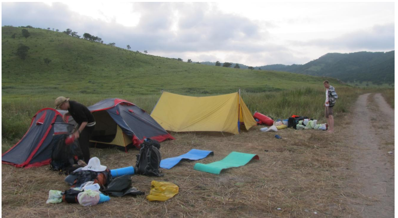
Фото 19. Размещение палаток за дорогой