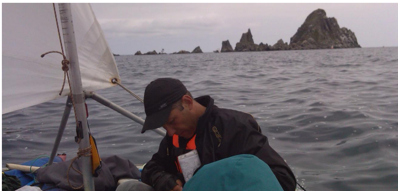
Фото 15. Камни у мыса Гамова