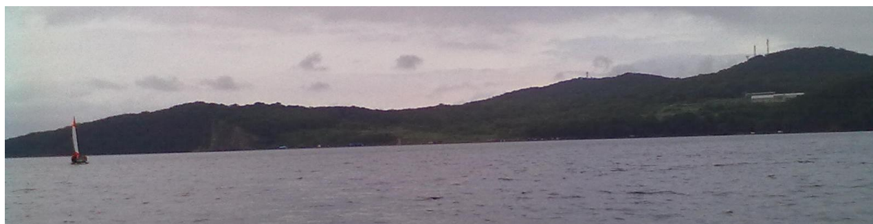
Фото 2. К2 идёт полуострова Новгородского

Первый катамаран – сплавной катамаран «модель 14» производства Кулика. Катамаран оснащён рамой и парусным вооружение, произведённым Куликом для 14 модели. Второй катамаран – «Бриз-микро», производства Тритон. Катамараны имели большие различия, вследствие чего скорость их различалась. Каждый катамаран шёл своим курсом к намеченной цели, стараясь оставаться в пределах видимости второго судна.