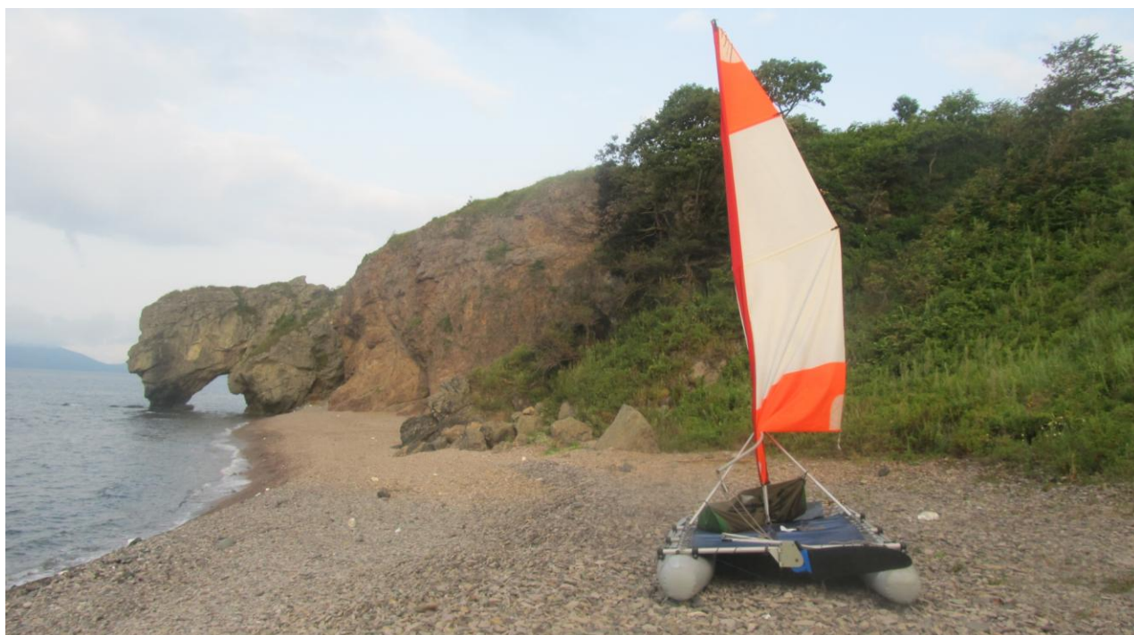
Фото 8. Вид на арку с берега

К1 к бухте подошёл в 20.00. Встали в бухте за красивым островком в виде арки (в виде арки там же и скала на берегу). К2 подошёл к 21.00. Последние 3 часа они шли на вёслах.