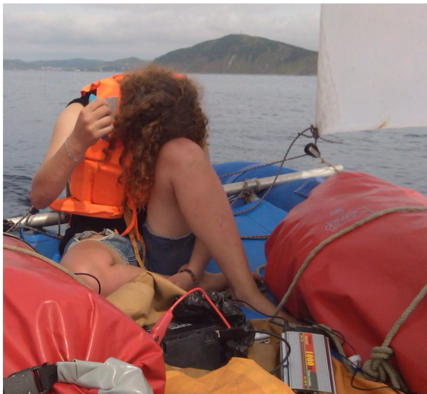
Фото 14. Зарядка сотовых телефонов на ходу

В 11.00 вышли в море. До мыса Гамова шли на вёслах. После поворота на север пошли по ветру. Ветер усилился до 3 м/с. До пляжа за мысом Льва дошли к 20.00. Первым высадился экипаж К2. На берегу к ним подошёл человек, потребовавший оплату. В результате переговоров удалось от оплаты отбиться, но на условия стоянки согласиться.