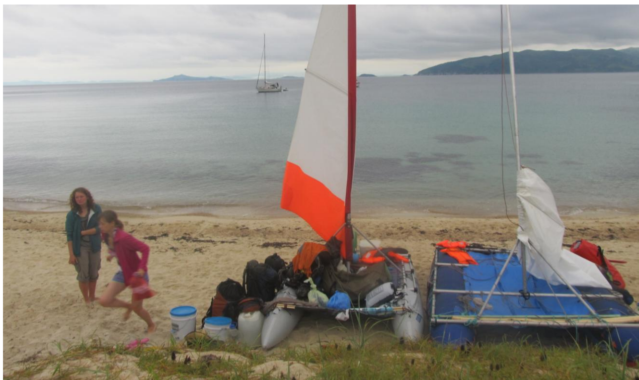
Фото 10. На острове Фуругельма