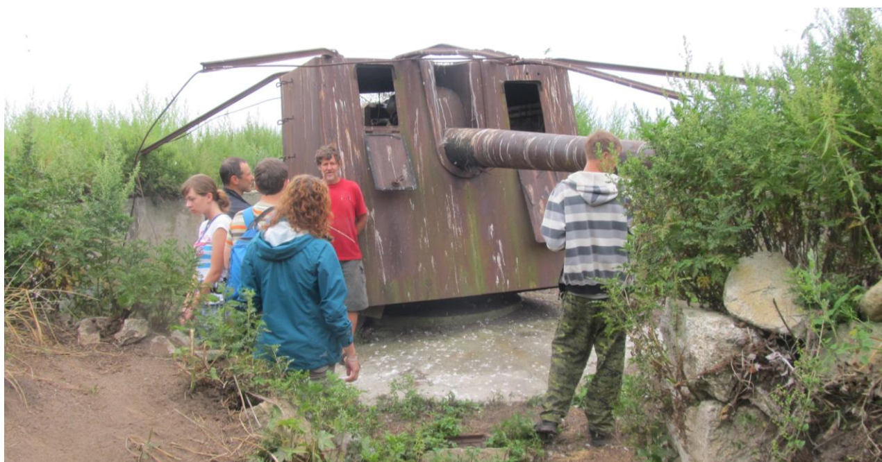
Фото 11. Экскурсия по острову Фуругельма