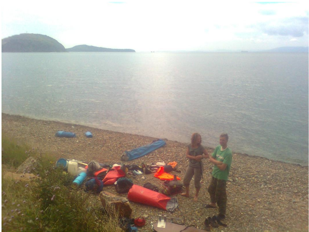
Фото 28. Экипаж К1 после разборки катамарана на мысе Токаревского (на дальнем плане остров Уши)