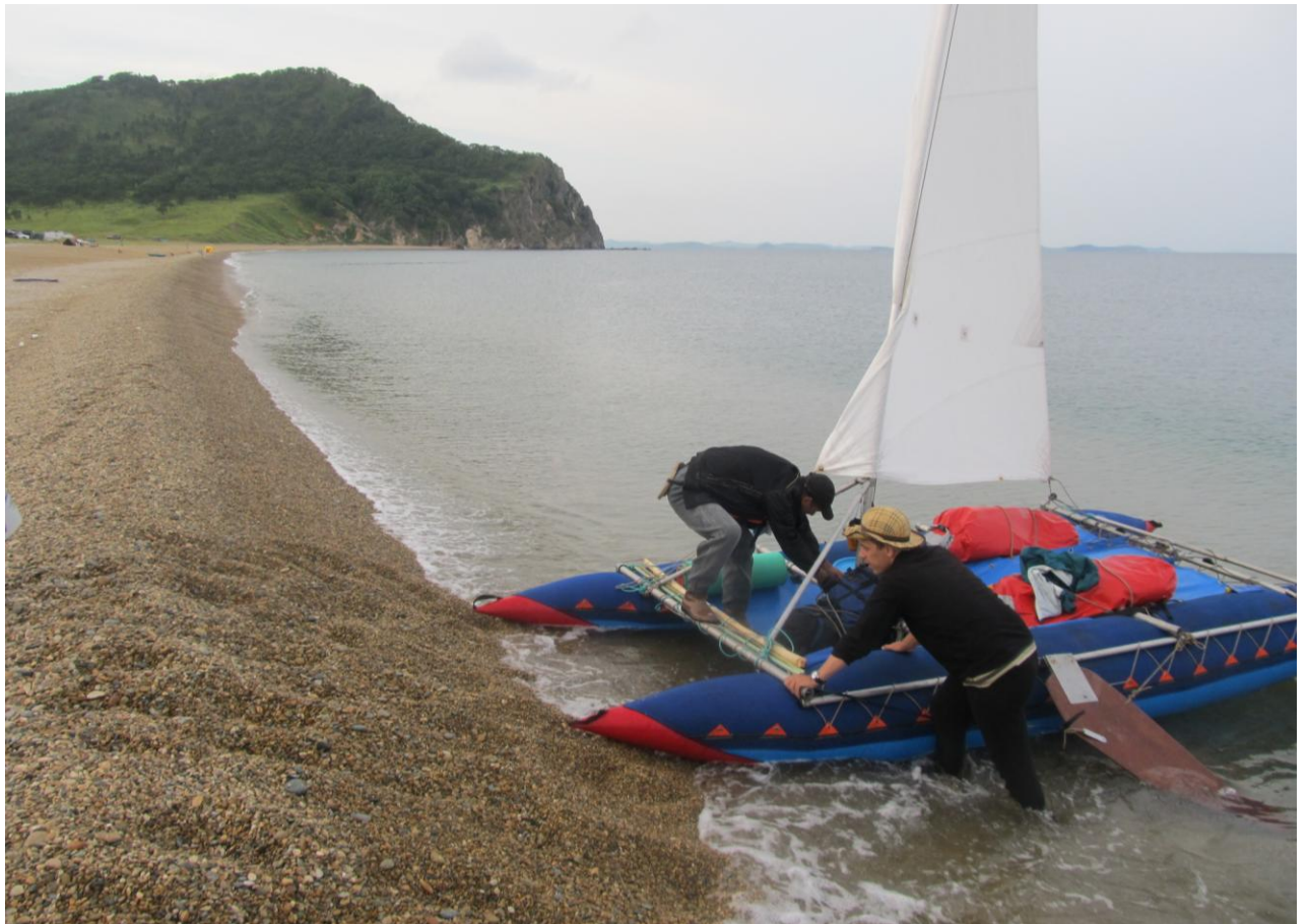
Фото 18. Разгрузка катамарана на пляже за мысом Льва