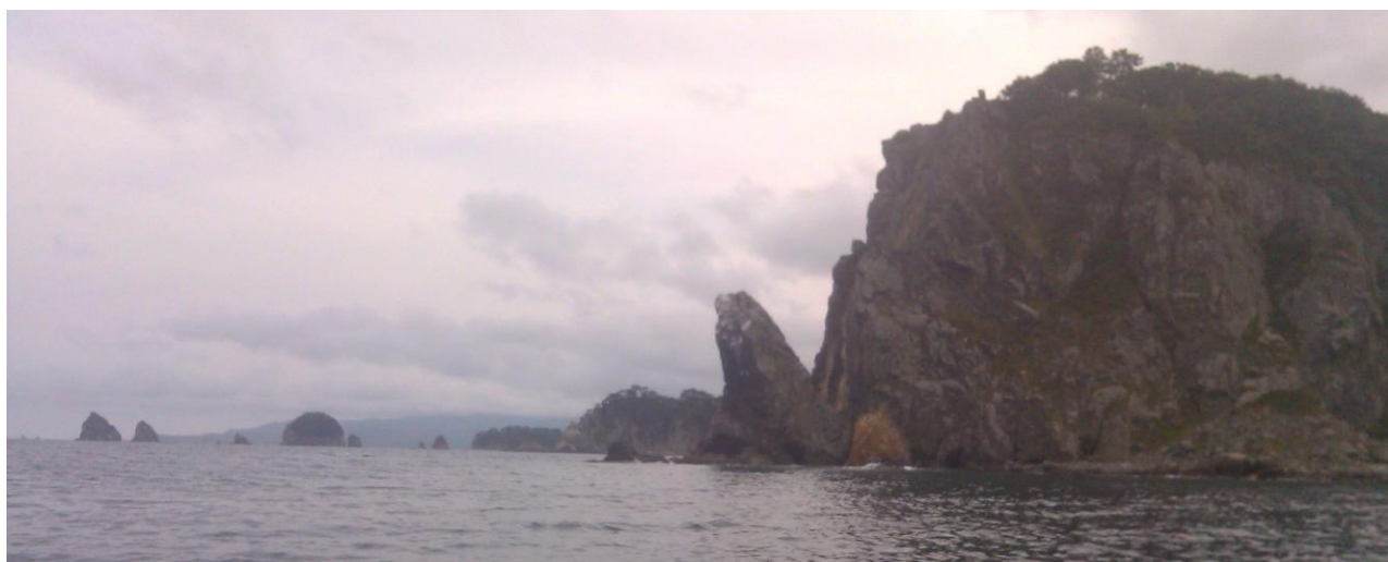
Фото 17. Мыс Льва

Берег у пляжа высокий. Катамараны затаскивали с трудом. Палатки ставили далеко от катамаранов, за дорогой, которая идёт вдоль всего пляжа. На пляже ставить палатки было запрещено. У левого края пляжа в море впадает речушка. Но места впадения с моря не видно, так как реку отделяет от моря вал песка (вода скорее всего просачивается через песок). Речушка разливается широко по долине, образуя болото. Идеальное место для размножения комаров. Комаров было много. Со слов охранников у места впадения реки в море справа бьёт ключик и можно набирать пресную воду, но мы рисковать не стали. Пляж оборудован самодельным туалетом.