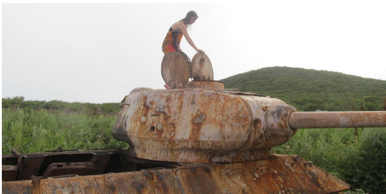
Фото 23. Осмотр танков на острове Желтухина