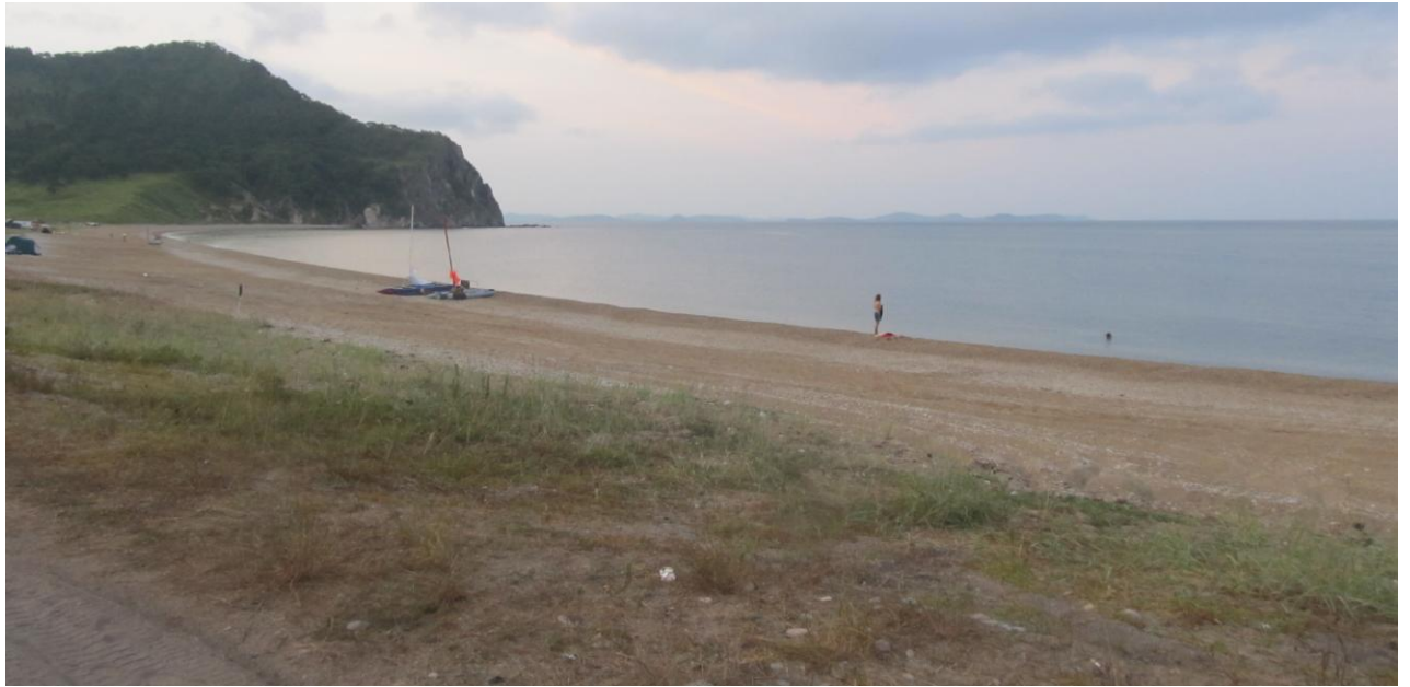
Фото 20. Оставленные на пляже катамараны