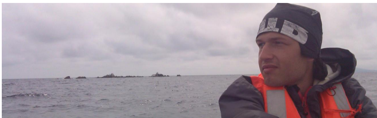
Фото 9. Камни возле острова Фуругельма

Вышли максимально рано – в 09.15. Ходовых качеств катамаранов не хватило, чтобы двигаться против ветра. К1 дошёл до острова только к 18.00. К2 дошёл гораздо позже (к 20.00). На экскурсию однозначно опоздали. На острове не разрешается оставаться на ночь. Но выбора у нас не было, пришлось ночевать на острове без палаток в беседке.