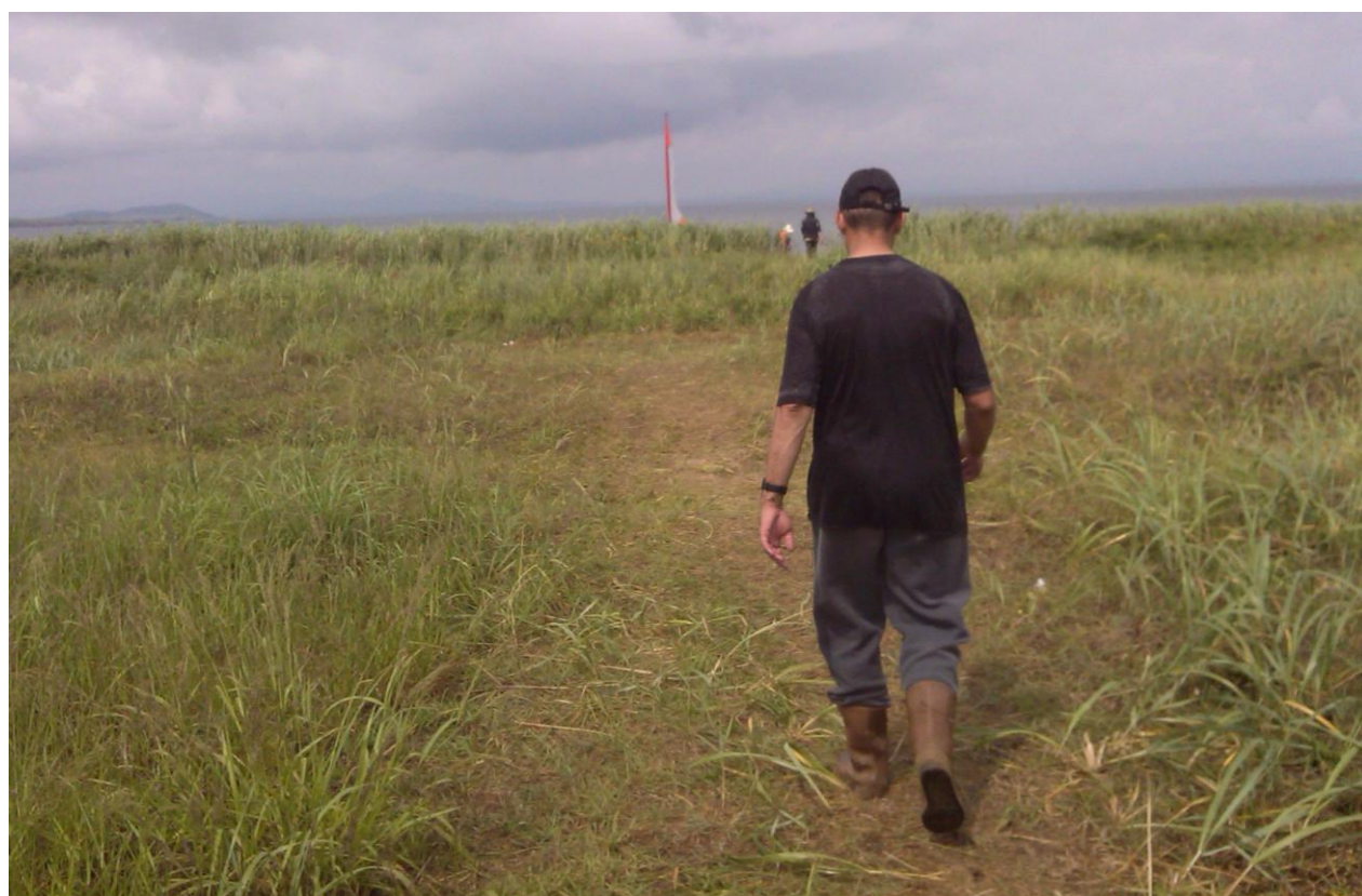
Фото 5. Тропа переноски катамаранов через косу Назимова (северный берег)