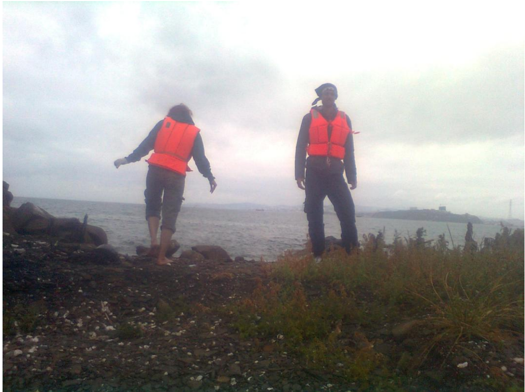
Фото 27. Экипаж К1 на острове Уши на фоне города Владивостока (справа мыс Токаревского)