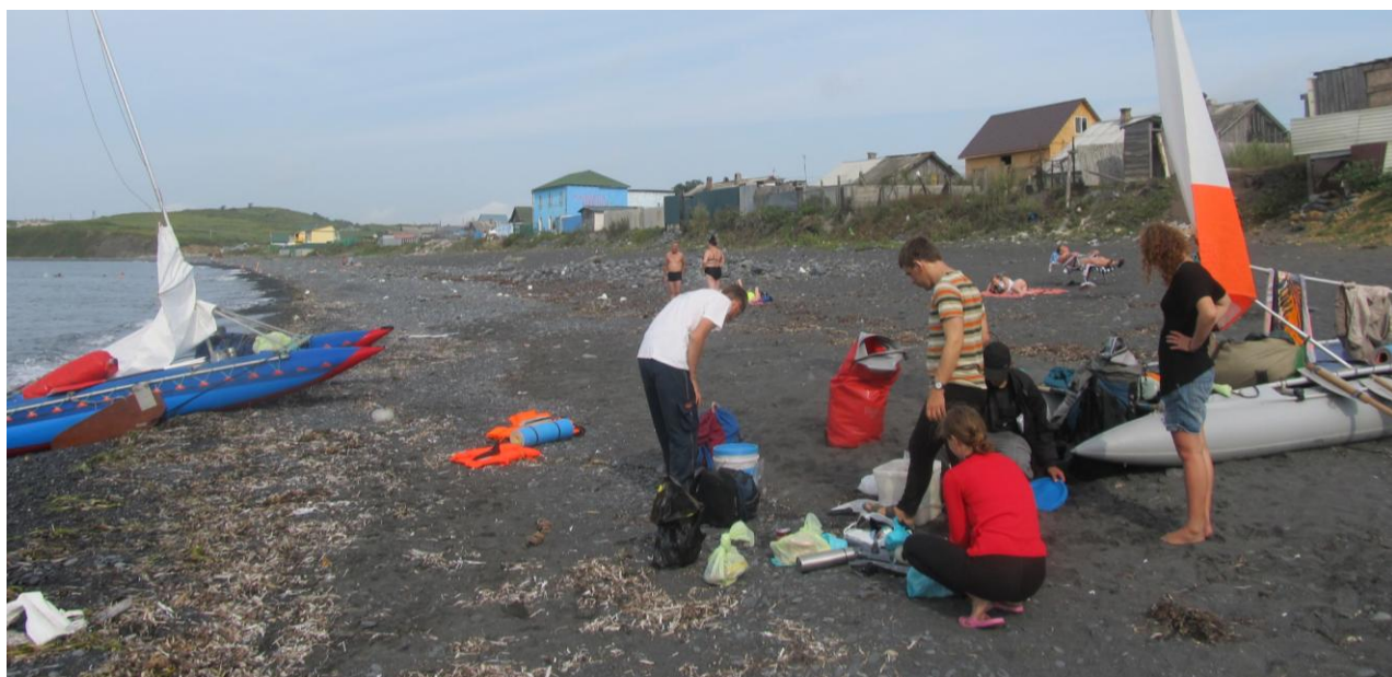
Фото 13. Место стоянки в п. Зарубино. Утренние сборы

С утра несколькими группами гуляли по посёлку. Закупали продукты, искали воду. Колодец с водой есть через дорогу между домами, но вода там жёлтая. Воду лучше набирать из родника, который расположен дальше. Самой сложной задачей было избавиться от накопившегося мусора. В августе два раза в неделю вечером по посёлку проезжает мусорная машина. Нам не повезло с днём недели, поэтому мусор удалось утилизировать только второй группе путём скупки у бабушек пирожков (по-другому получить информацию не получилось).