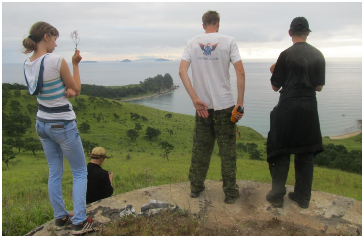
Фото 22. Наблюдательный пост береговой батареи № 251

Дежурные встали в 06.00. Завтрак в 07.00. С 08.00 по 10.05 совершили радиальный выход вдоль границы заповедника на береговую батарею № 251.