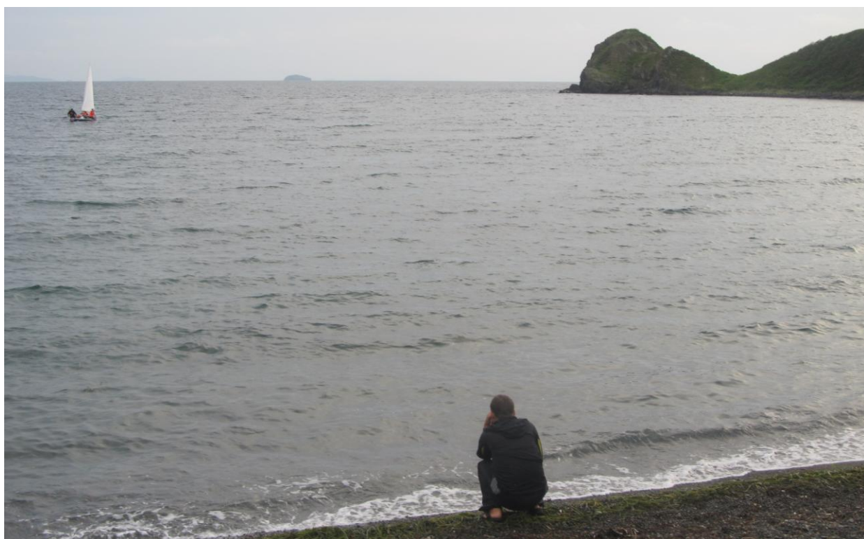
Фото 25. Вход К1 в южную бухту острова Пахтусова