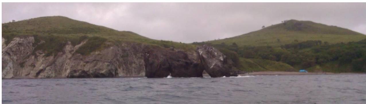
Фото 7. Вид бухты со стороны моря (западнее бухта с базой отдыха)

Один из вариантов плана похода предполагал перед пересечением границы заповедника встать на стоянку севернее мыса Острено, на следующий день сделать радиальный выход на озеро Птичьё. Подсчитали имеющееся в нашем распоряжении время и выяснили, что на радиалку времени нет. К тому же смогли реально увидеть гору Острено, обходить её желания не возникло. Поэтому было решено: в качестве плацдарма использовать проверенное место на полуострове Краббе. В бухте Агатовой как раз имелся родник для пополнения запаса пресной воды (в гроте вода стекает по стене и капает вниз, за ночь набирается ведро воды).