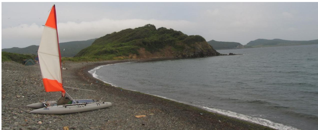
Фото 24. Южная бухта острова Пахтусова

С 18.40 до 20.20 совершили переход к островам Пахтусова, пройдя между островами Моисеева, Сергеева и Кротова в поисках птичьих базаров и лежбищ котиков. Полюбовались скалами, котиков так и не обнаружили. Встали в южной бухте острова Пахтусова.