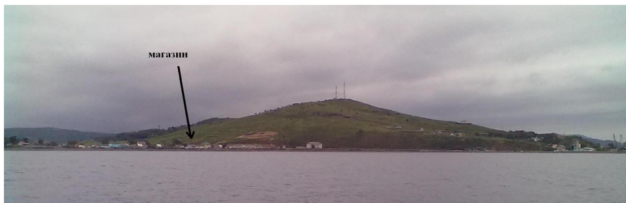
Фото 12. Посёлок Зарубино. Ориентир – две антенны на сопке

К2 на час позже. Торопились успеть в магазин для закупки продуктов, на берег вышли напротив магазина. Оказалось, что рабочее время магазина до 23.00. Ночевали прямо посреди посёлка на пляже.