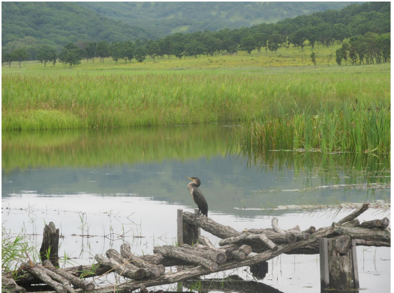
Фото 21. Долина реки за пляжем мыса Льва (источник комаров)

21.08.14. Пересечение Уссурийского залива