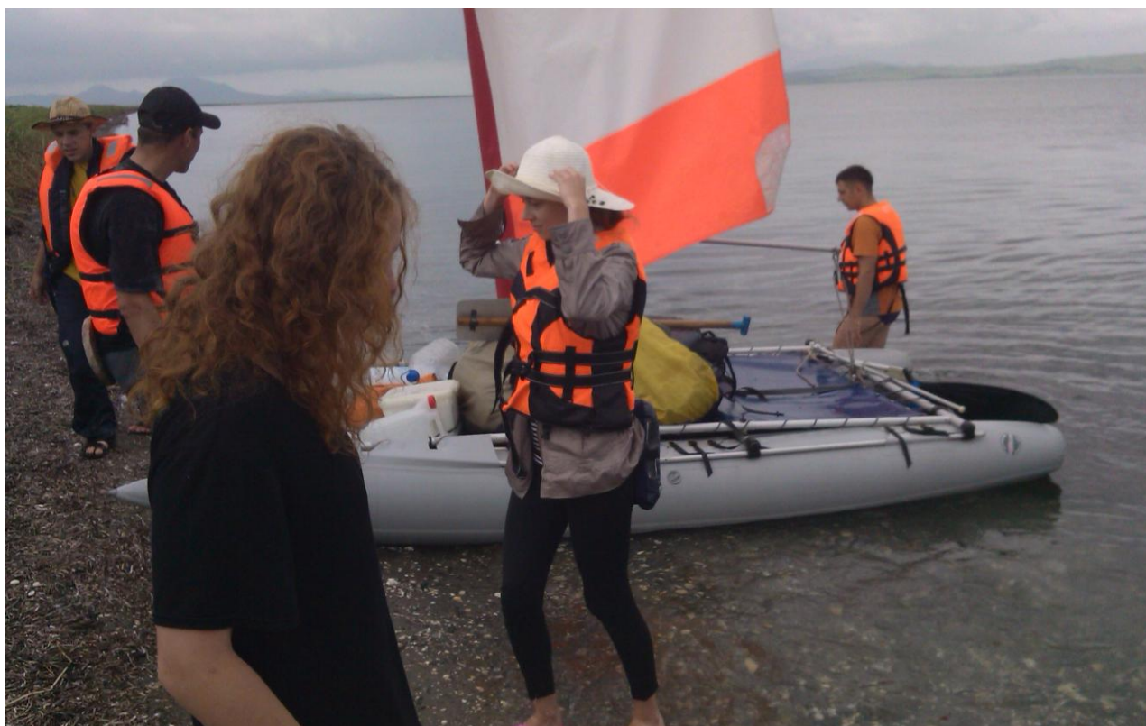
Фото 4. Место высадки на косу Назимова (северный берег)