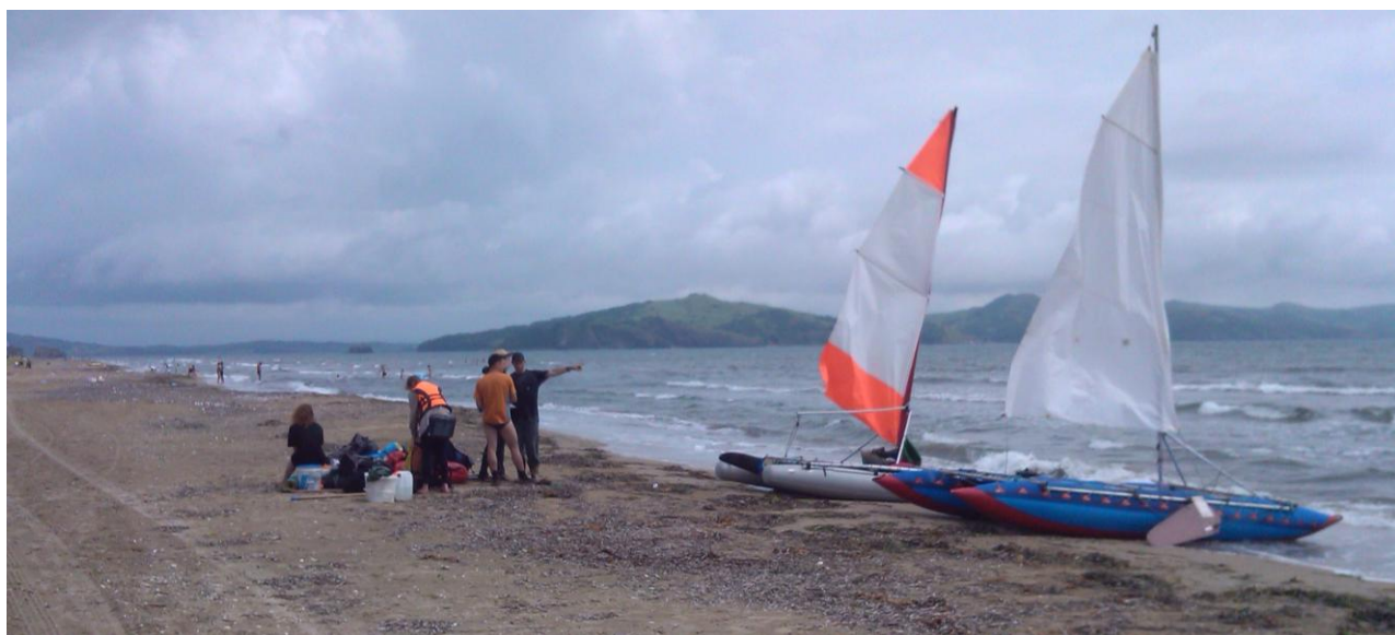
Фото 6. Южный берег косы Назимова

Покупались, перекусили, в 14.00 опять вышли в море.