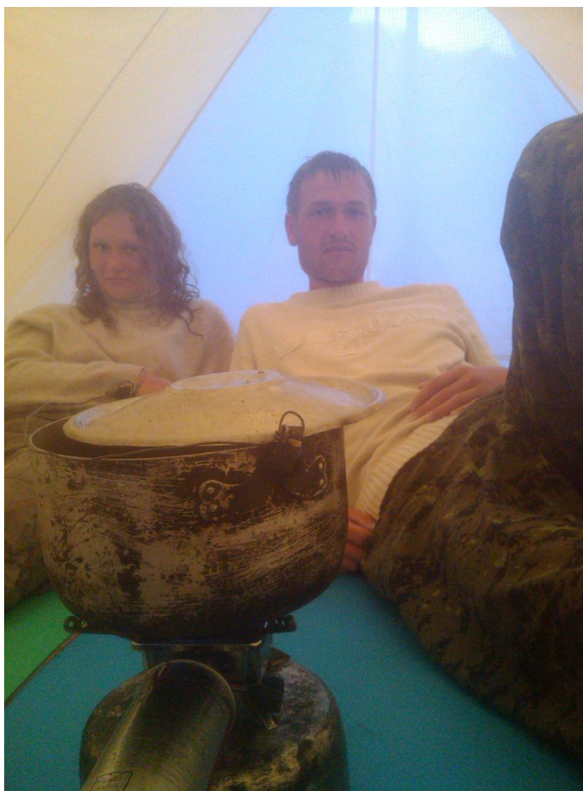
Фото 26. На о. Попова из-за дождя и ветра ужин готовили в палатке

Галсами практически через весь Уссурийский залив К1 удалось дойти к 17 часам до о. Попова. Многократно лил проливной дождь. Дальнейшие попытки лавировать против ветра не приводили к продвижению на север – возвращались в ту же точку (если не южнее). К 18.00 было принято решение оставить попытки дойти до острова Русского (с последующим отъездом в город на такси) и высадиться на о. Попова рядом с паромной переправой (с целью использовать запасной день для достижения мыса Токаревского или при невозможности этого воспользоваться паромом).