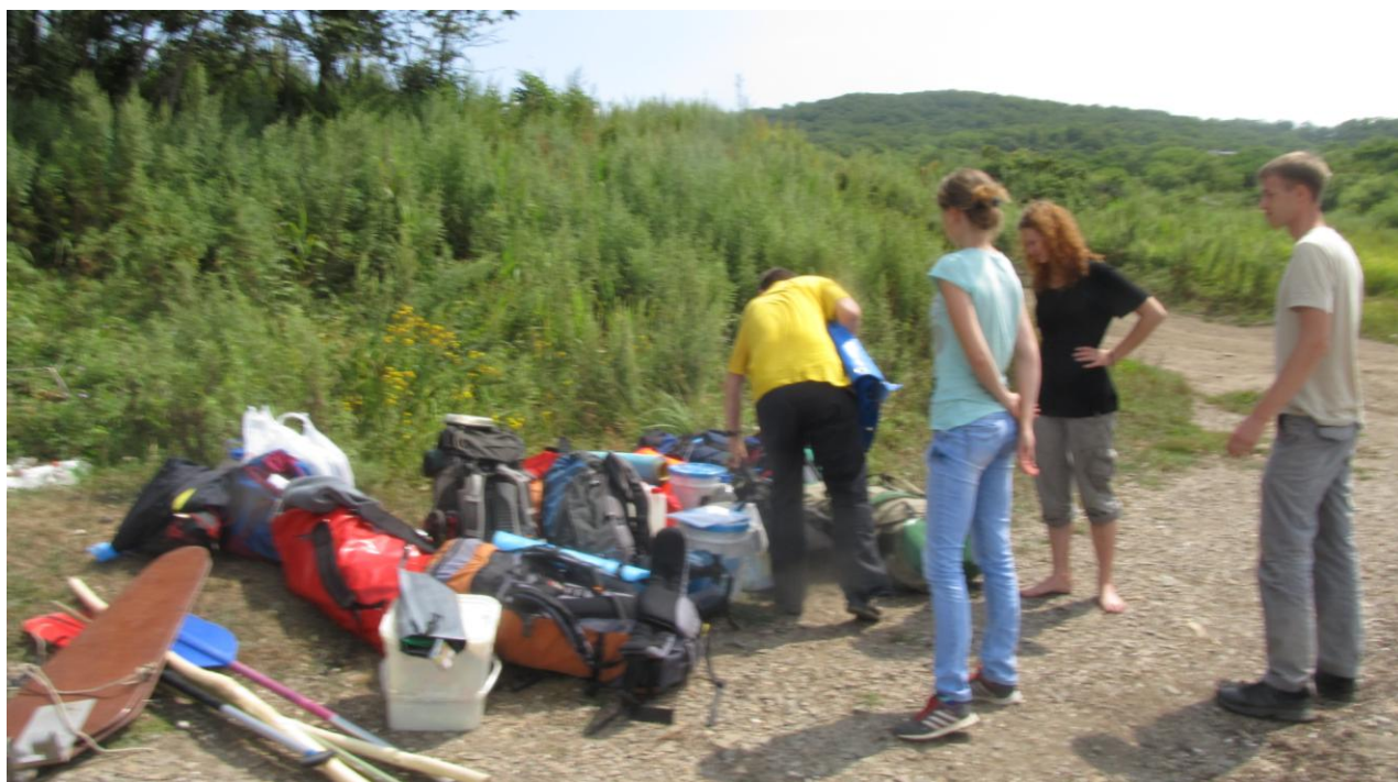
Фото 1. Место старта у п. Посъет

Сбор группы производился в помещении спелеоклуба. В 11.00 к клубу подъехал автобус, полчаса загружались. Выехали после 11.30. К 15.00 были уже на месте сборки катамаранов возле Посъета. К 17.40 собрали суда. Вышли в море.