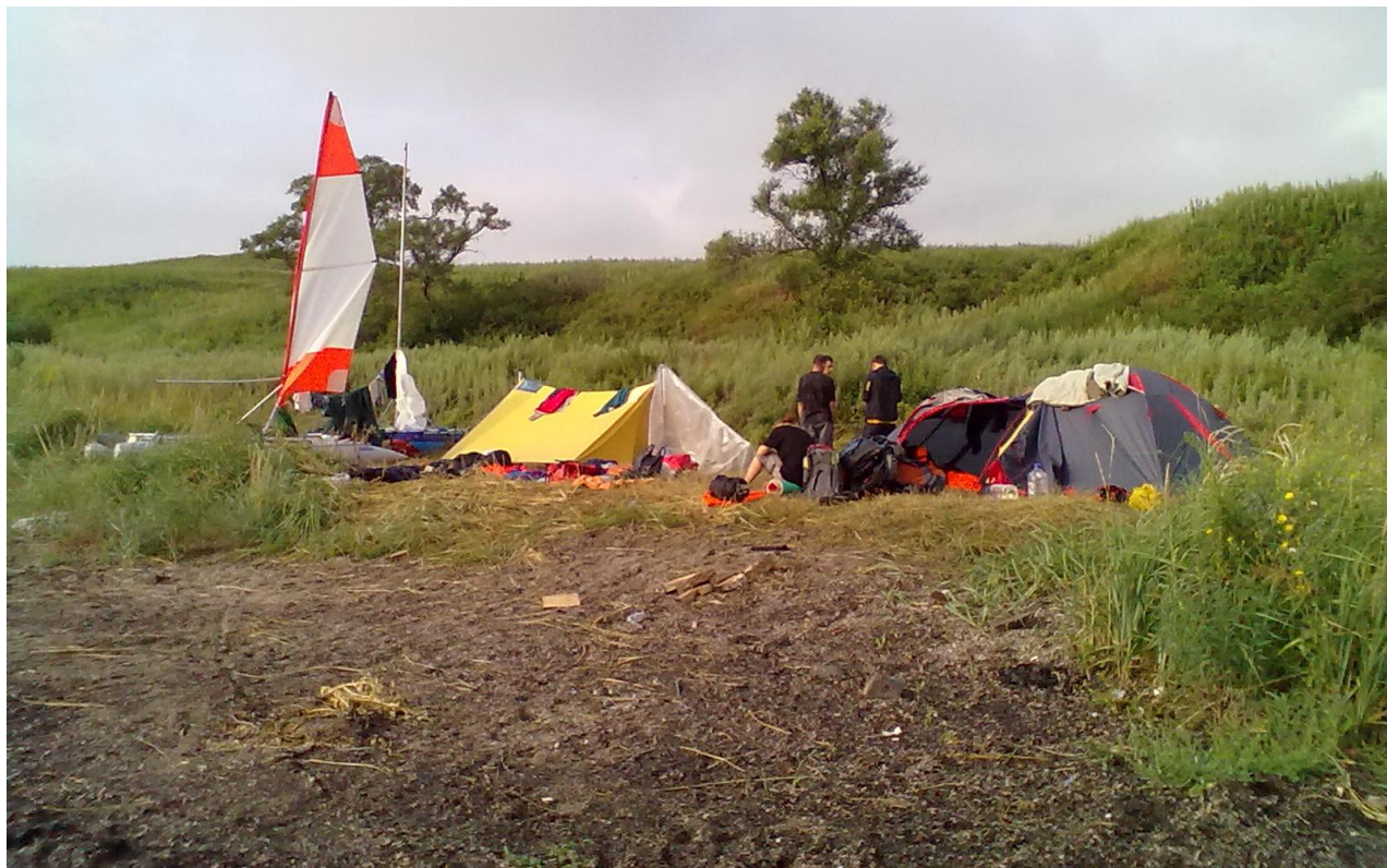
Фото 3. Стоянка на мысе Андреева (вид со стороны моря)

Из-за встречного ветра добраться до косы Назимова не удалось. Решили высадиться на мысе Андреева. В 20.40 высадился экипаж К1, в 20.49 – экипаж К2. Стоянка оказалась удобной, а главное – свободной от отдыхающих. Воды нет. К стоянке утоптана автомобильная колея, но съездов с колеи нет, так как остальные берега на протяжении около километра не пригодны для стоянки.