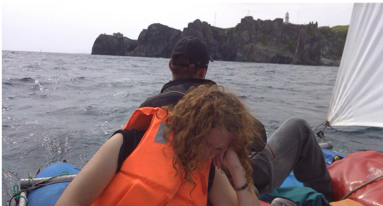
Фото 16. Маяк Гамова

Берег у пляжа высокий. Катамараны затаскивали с трудом. Палатки ставили далеко от катамаранов, за дорогой, которая идёт вдоль всего пляжа. На пляже ставить палатки было запрещено. У левого края пляжа в море впадает речушка. Но места впадения с моря не видно, так как реку отделяет от моря вал песка (вода скорее всего просачивается через песок). Речушка разливается широко по долине, образуя болото. Идеальное место для размножения комаров. Комаров было много. Со слов охранников у места впадения реки в море справа бьёт ключик и можно набирать пресную воду, но мы рисковать не стали. Пляж оборудован самодельным туалетом.